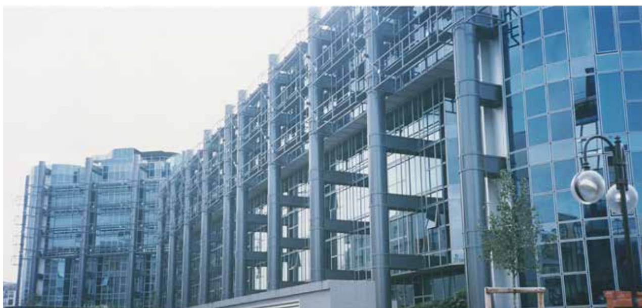
ESCP BS CAMPUS CHAMPERRET

Des échanges à poursuivre afin de mieux faire connaître les multiples opportunités qu'offrent les formations dans les écoles de management aux élèves des CPGE littéraires et de mettre en lumière la richesse des compétences des étudiants littéraires, de plus en plus appréciés par les entreprises.